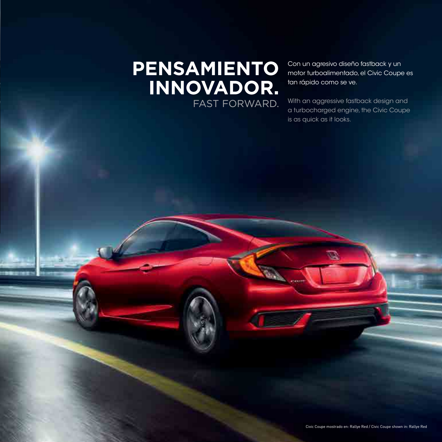
Civic Coupe mostrado en: Rallye Red / Civic Coupe shown in: Rallye Red

With an aggressive fastback design and a turbocharged engine, the Civic Coupe is as quick as it looks.