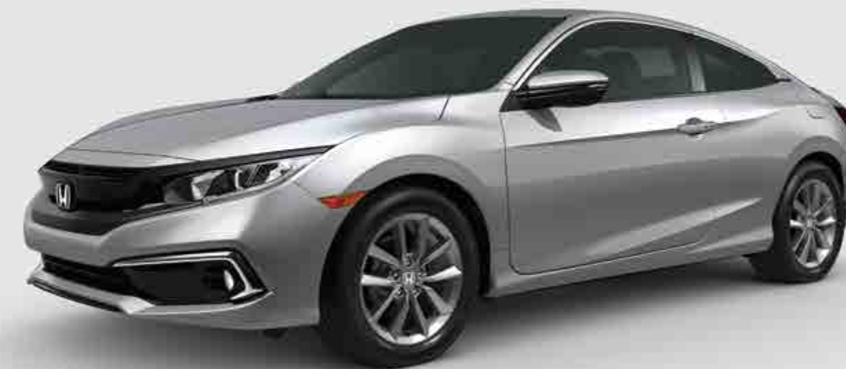
Civic Coupe mostrado en: Lunar Silver Metallic / Civic Coupe shown in: Lunar Silver Metallic