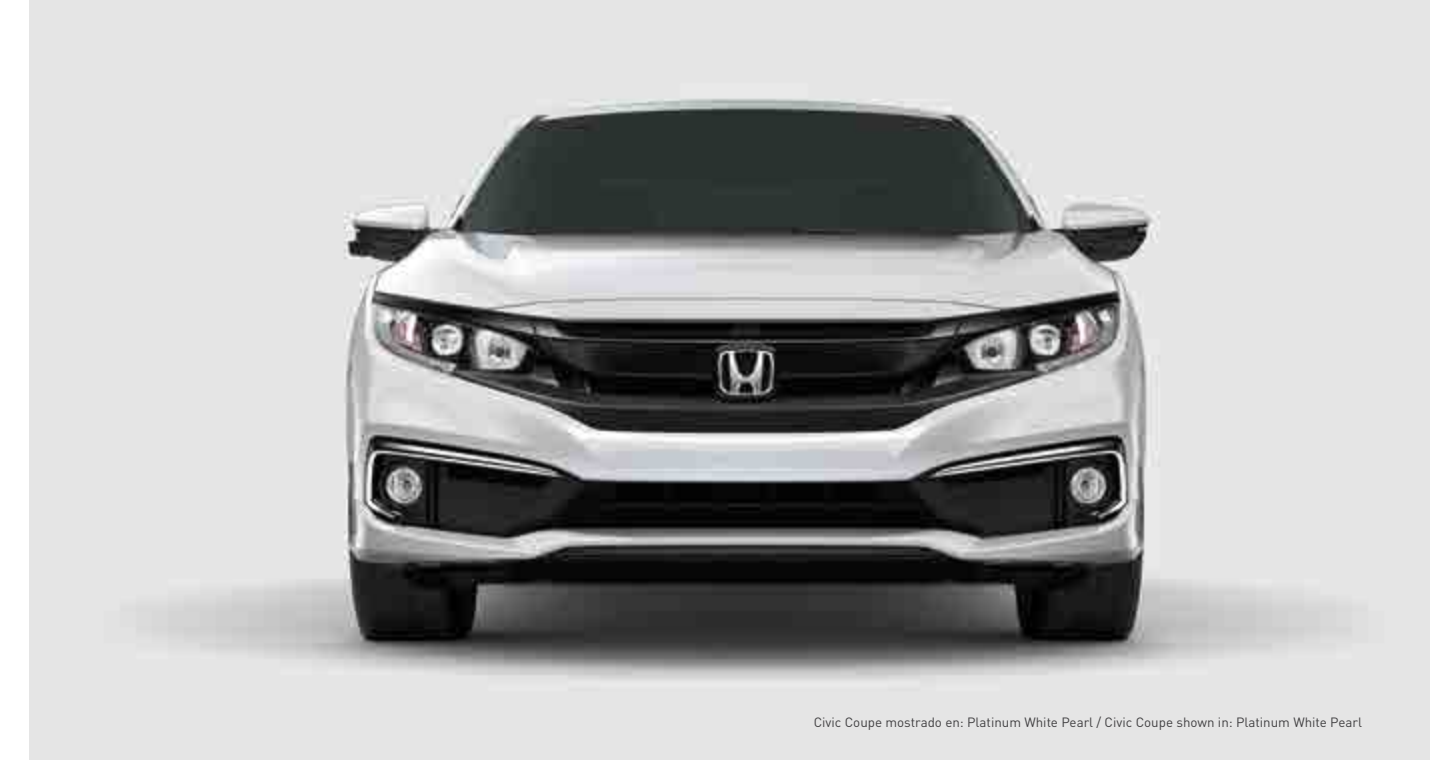
Civic Coupe mostrado en: Platinum White Pearl / Civic Coupe shown in: Platinum White Pearl