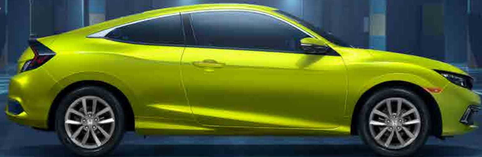
Civic Coupe mostrado en: Yellow Tonic Pearl / Civic Coupe shown in: Yellow Tonic Pearl

Every Civic is equipped with advanced safety features designed to help protect you and your passengers, kilometer after kilometer.